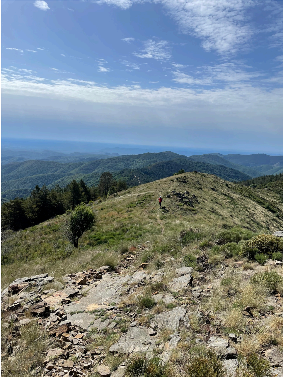
Descente le long de la crête pour rejoindre le col de Lougarès