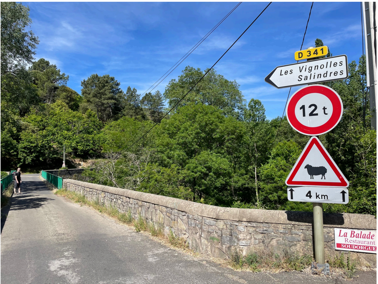
Puis retour par la vallée de la Salindrenque