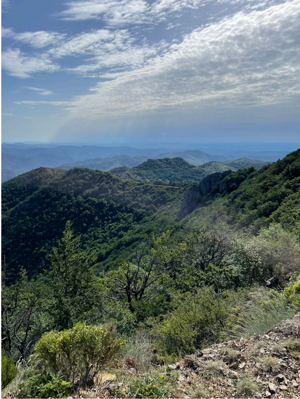
Vue vers la vallée de la Salindrenque