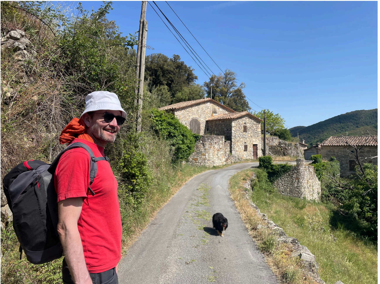
Arrivée à La Coste