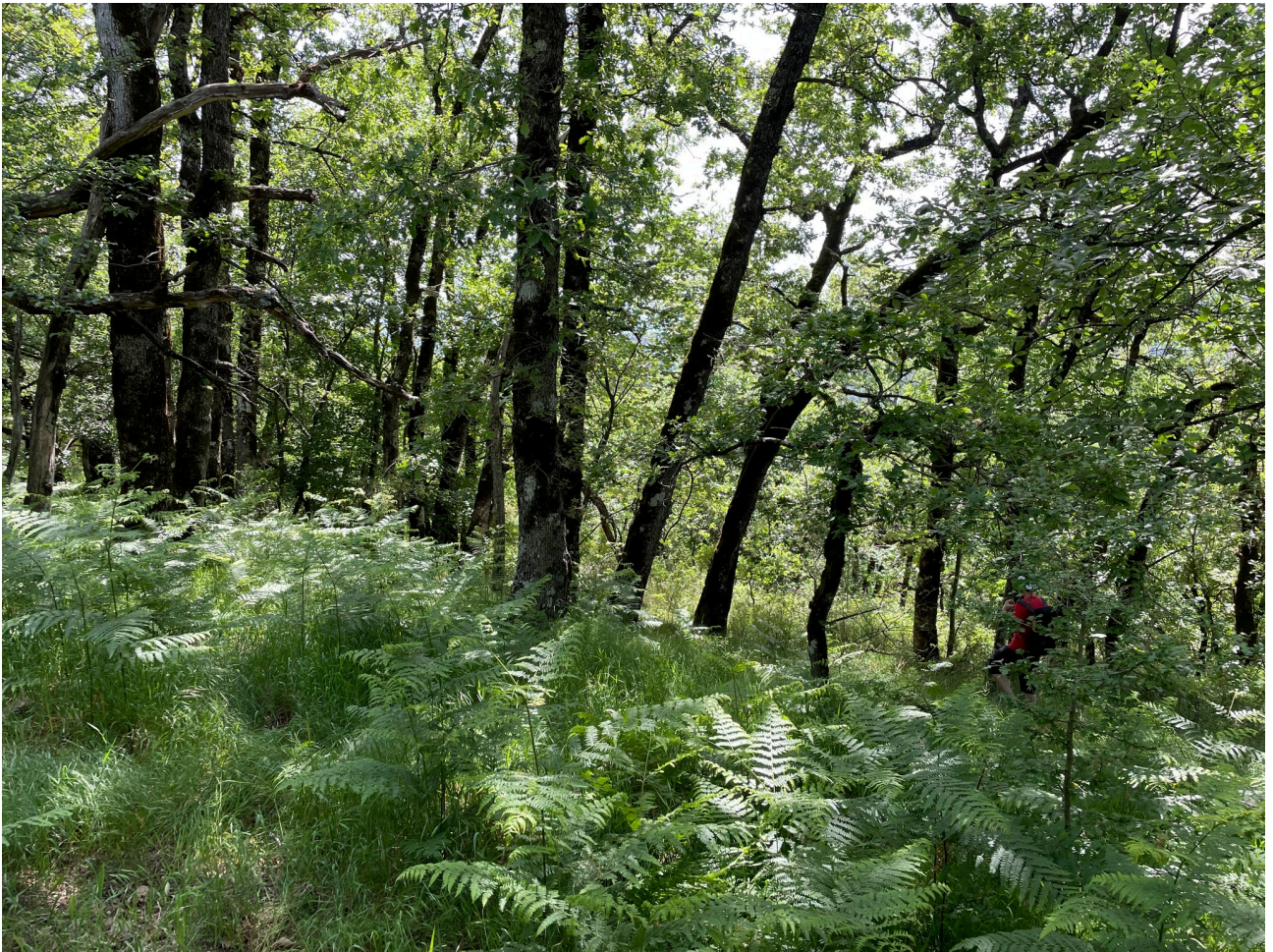
Descente vers la vallée de la Salindrenque