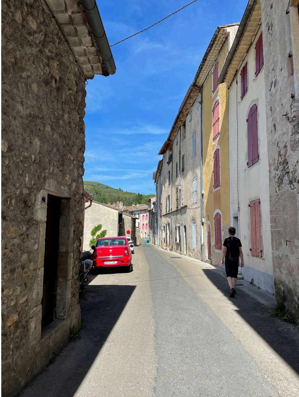
2e jour, passage à Lasalle