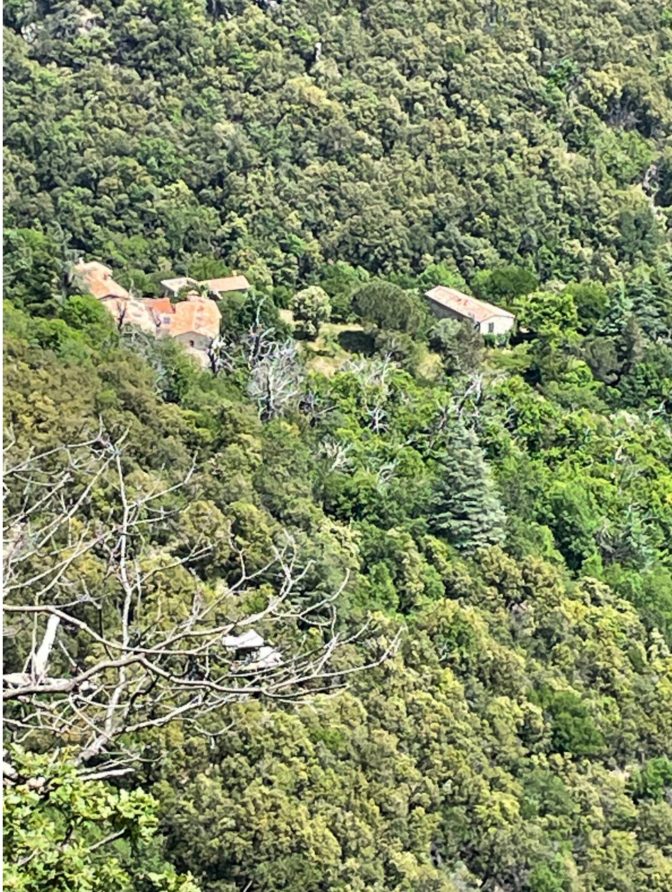
Le hameau des Crémats