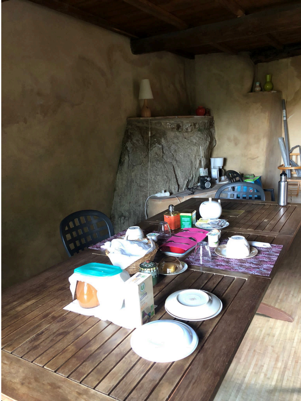
Le petit déjeuner est hallucinant. Fromage, charcuterie...