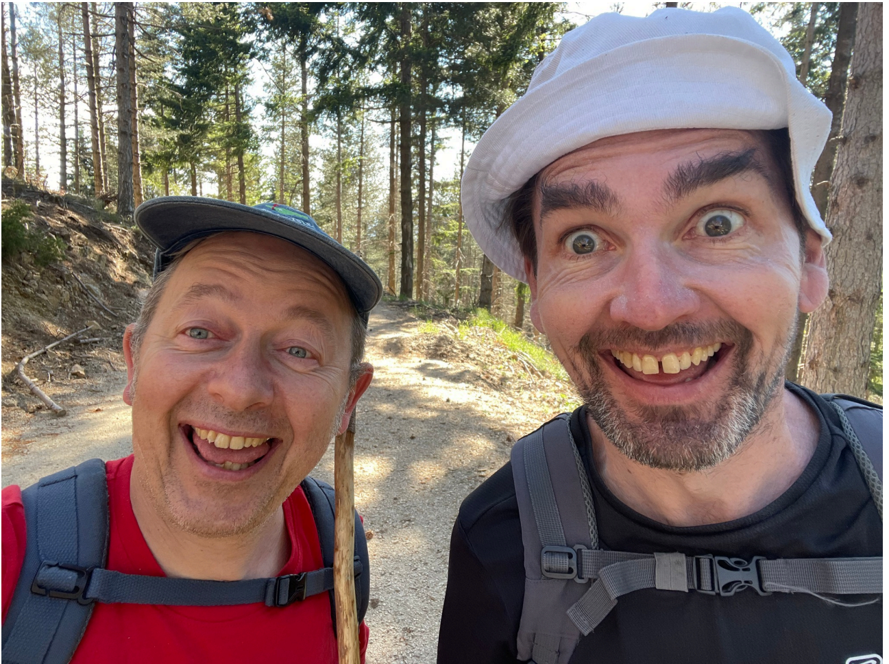
Passage du col de Lougarès