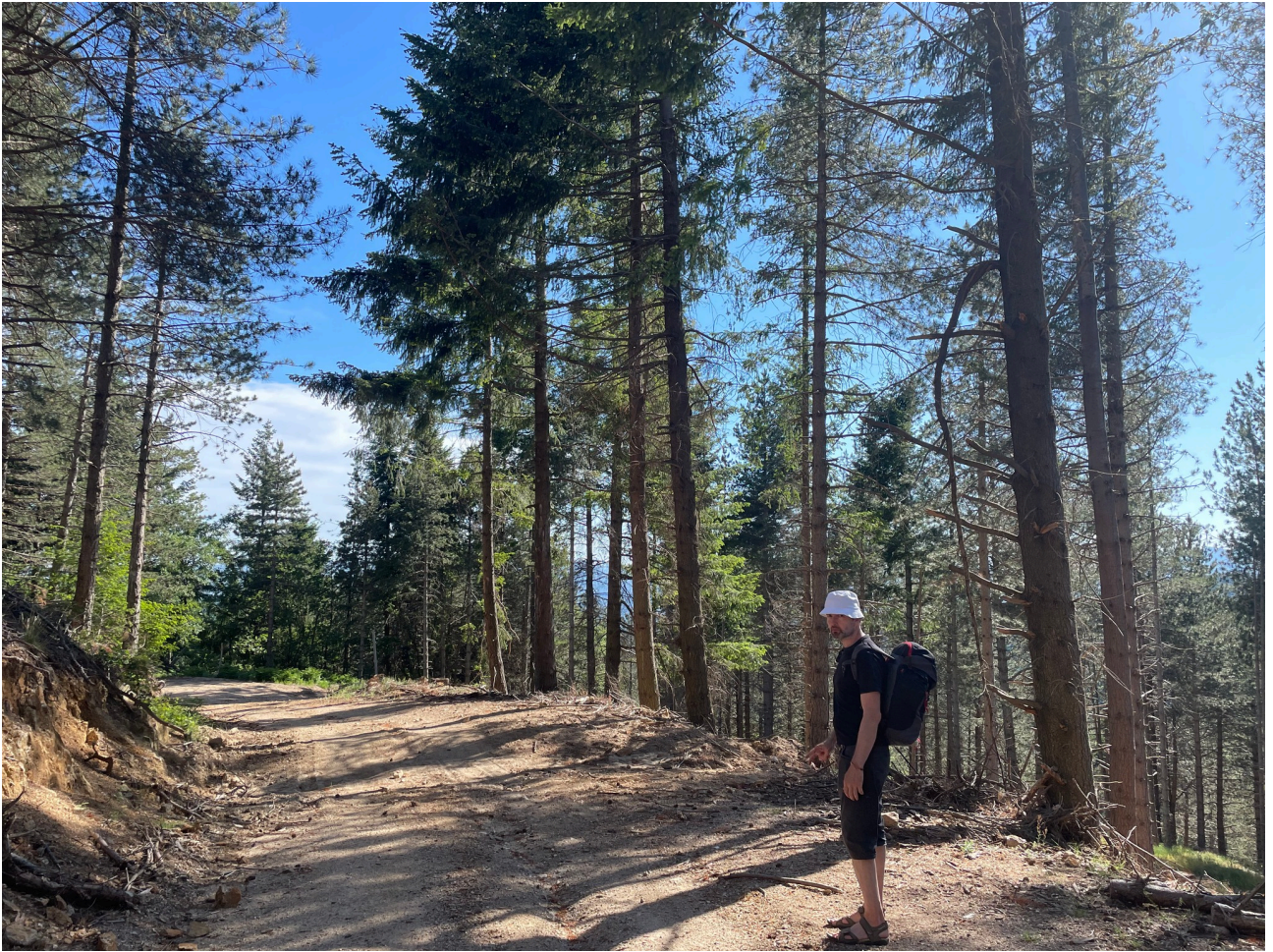
Descente vers la vallée du Rieutord